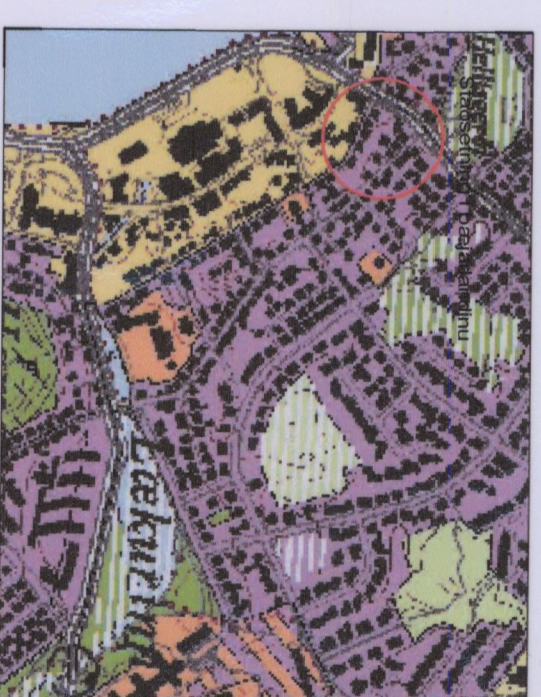
Úrdráttur úr aðalskipulagi Hafnarfjarðar

Kvóð er um aðkeyrslu að blískur Hverfisgötu 4b um lóðina Hverfisgötu 6b. Kvóð er um aðkeyrslu að blískur Hverfisgötu 6b um lóðina Hverfisgötu 4b.